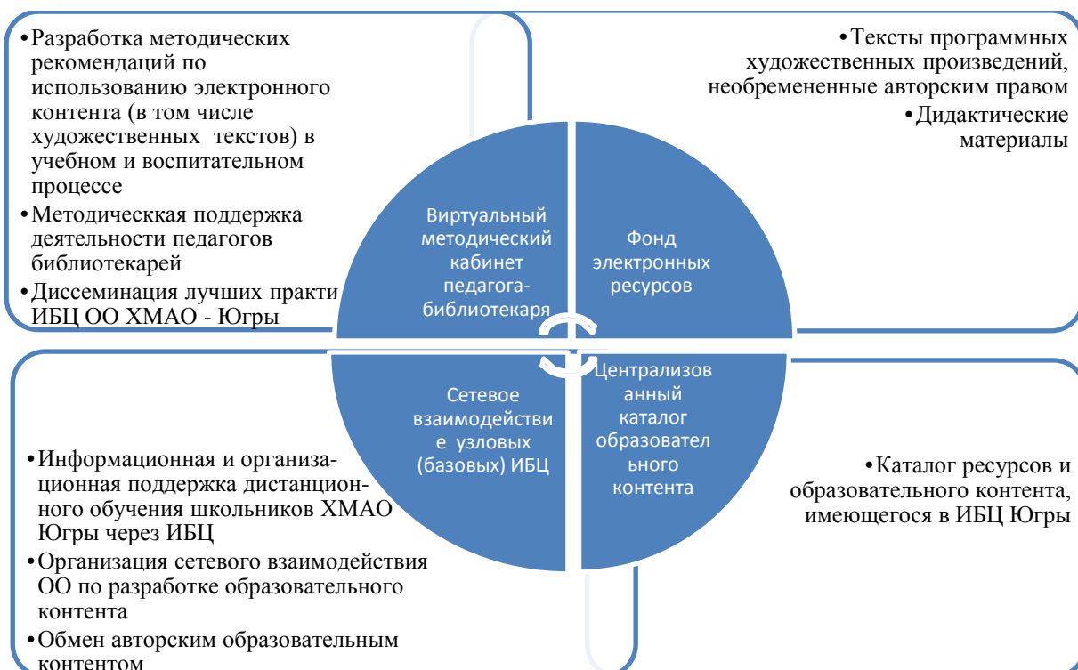
Рисунок 2. Модель структуры контента и содержания деятельности РИМБЦ

Модель структуры контента и содержания деятельности РИМБЦ представлена на рисунке 2.